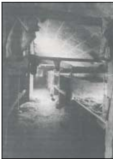
Une baraque du camp de femmes.