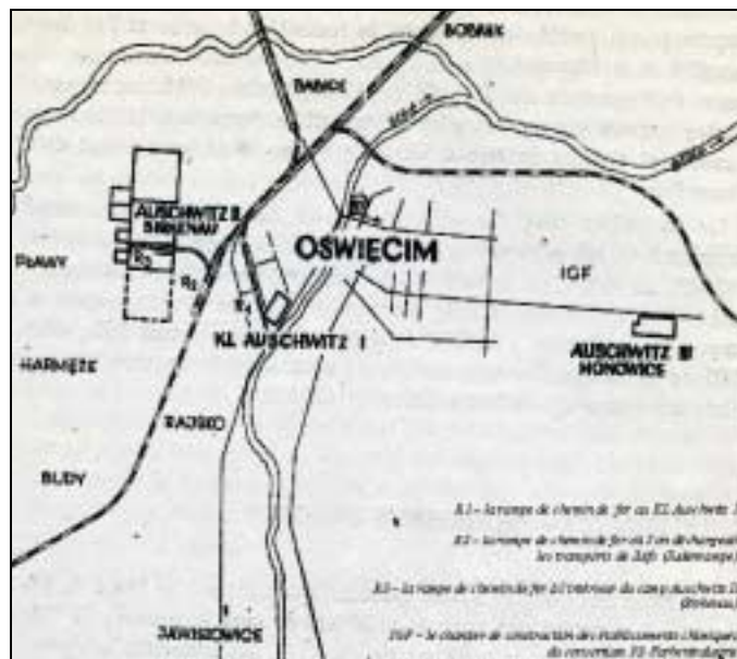
Zone d'intérêt du KL d'Auschwitz.

Les exploitations agricoles voulues par Himmler sont évoquées dans ce paragraphe consacré à la construction du complexe et non dans celle des Kommandos et camps annexes, parce qu'elles sont étroitement associées au concept qui a présidé au choix du site d'Auschwitz. Lorsqu'il vient à Auschwitz en mars 1941, et à la suite d'un rapport des responsables de l'administration des exploitations agricoles, forestières et de pisciculture, Himmler décide en effet de créer un domaine appartenant à la SS tout autour du KL d'Auschwitz, dans ce qui est considéré comme la troisième zone, incluant les villages de Babitz, Broschkowitz, Birkenau, Budy, Harmenze, Plawy et Rajsko. L'ensemble doit comporter selon les plans une station expérimentale