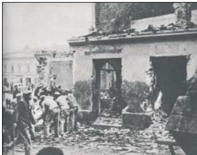
Détenus occupés à la destruction de maisons polonaises après expulsion des habitants.