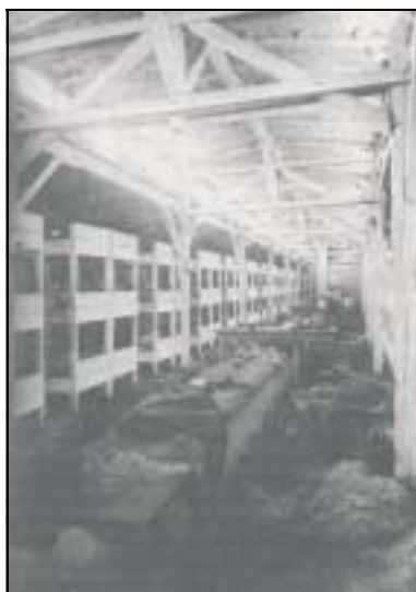
Une baraque écurie du camp des hommes.

Aucune installation sanitaire n'est prévue avant 1944 et les baraques ne sont initialement pas éclairées.