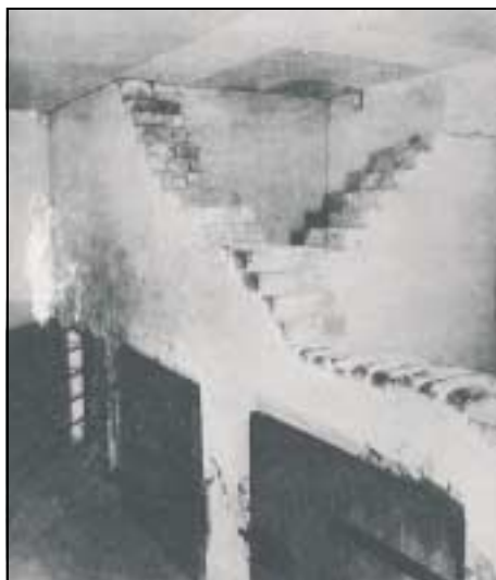
La cellule à rester debout.

sanction finale est une peine de travail punitif de dix dimanches consécutifs.