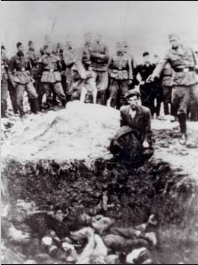
Einsatzgruppen en action.