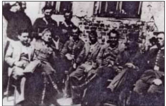
Équipe de gardes à Chelmno.

Chelmno est un lieu retiré, mais doublement accessible par voie ferrée, ce qui facilite l'acheminement des trains de déportés (moyennant toutefois un changement de matériel roulant à la gare de Warthebrücken, du fait du resserrement des voies) et par la route qui permet l'accès des convois routiers. Dans le cadre de la germanisation des terres entreprise après la chute de Varsovie, le village et quelques fermes sont déjà partiellement habités par des familles de colons allemands 5 . Les SS du Sonderkommando Lange s'installent dans les dépendances d'un ancien château à proximité de la station de chemin de fer. Le