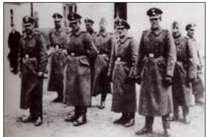
Equipe de garde à Belzec. © Expo permanente Wannsee.

© Expo permanente Wannsee. Le camp est classé « zone secrète » et son accès rigoureusement interdit. A l'arrivée des trains les chemins sont relevés par une équipe spéciale. L'aspect général