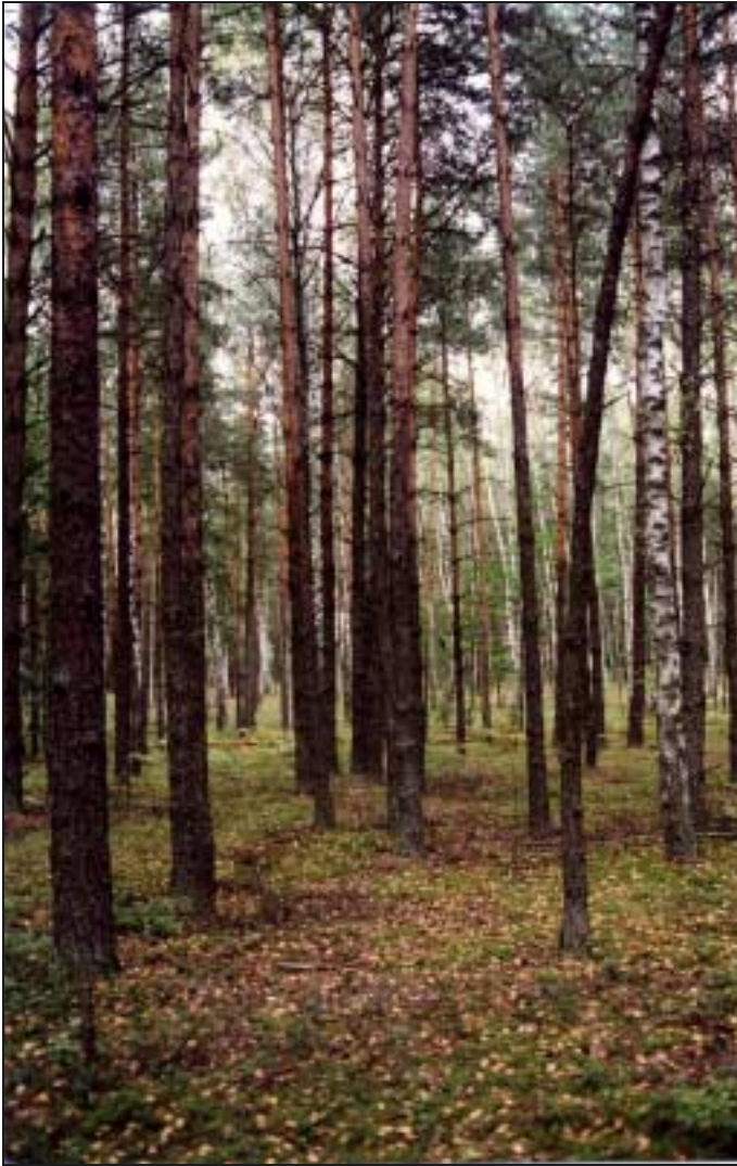
Forêt de Sobibor replantée sur l'emprise du camp et les fosses.

l'effectif et les habitudes des gardes, et mûrit son plan. Au jour J (14 octobre 1943) les personnels allemands de la garde de service sont attirés dans un piège dans des baraquements ateliers sous divers motifs, assaillis et tués par des détenus munis de haches et de gourdins qui s'emparent aussitôt des armes. L'alerte est donnée mais rien ne peut plus empêcher les révoltés de se ruer vers la clôture, dont le courant est préalablement coupé par un électricien, membre du Kommando, sous les tirs des sentinelles des miradors. Un passage est ouvert dans les barbelés et les champs de mines, au prix de nombreux morts. Les SS de leur côté acheminent des renforts, massacrent les détenus encore présents au camp puis déclenchent une impitoyable chasse à l'homme. Une cinquantaine de fuyards sont repris et abattus mais quarante à cinquante réussissent malgré tout à échapper aux poursuites et à la mort. Quelques uns décriront le fonctionnement du camp, l'horreur des massacres et les tentatives désespérées de résistance des victimes poussées vers les chambres à gaz. Le symbole et la portée de cette révolte sont considérables : pour la première fois, des SS, « dieux vivants invulnérables » sont tués par leurs victimes, et pour la première fois ceux auxquels est déniée toute humanité affirment le contraire dans un ultime combat qui aura pour conséquence la fermeture du site et l'arrêt des massacres de masse à Sobibor.