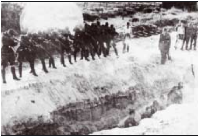
Einsatzgruppen en action.