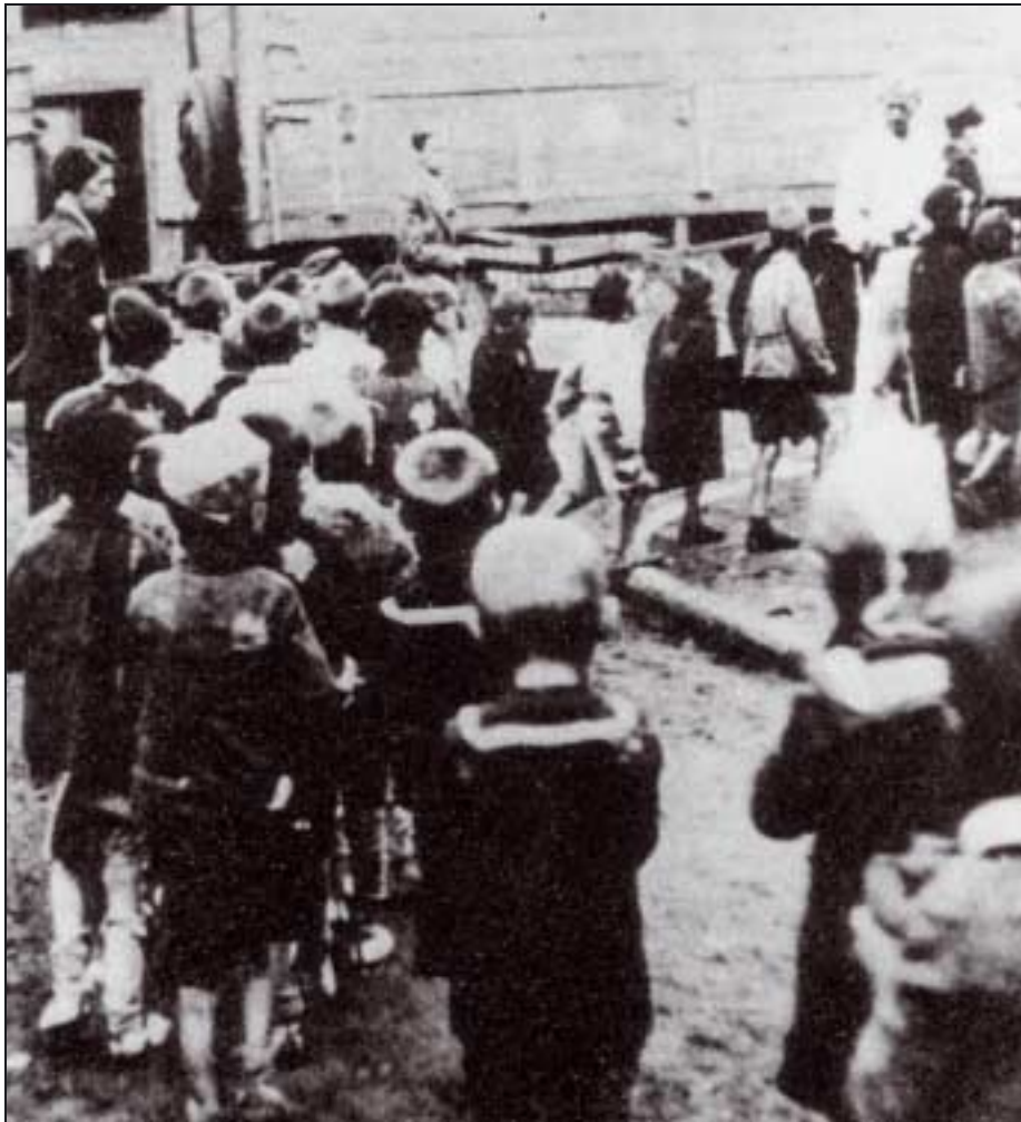
Réinstallation au ghetto de Łódź en septembre 1942.

et baltes), le tout représentant un effectif d'environ 33 000 hommes. Ces troupes spéciales sont articulées en 4 groupes opérant directement derrière le front, et tactiquement subordonnés à la Wehrmacht. En revanche leurs missions sont reçues, en principe, directement du RSHA.