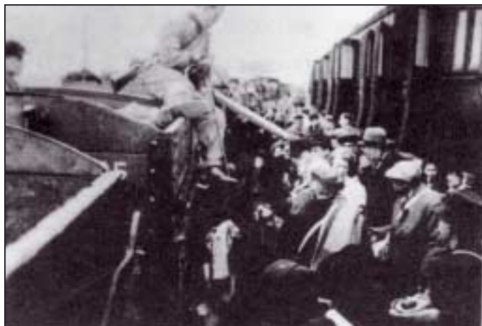
Arrivée d'un convoi à Sobibor.

Une première vague couvre les mois de mai, juin et juillet 1942. Elle concerne les Juifs de la région de Lublin