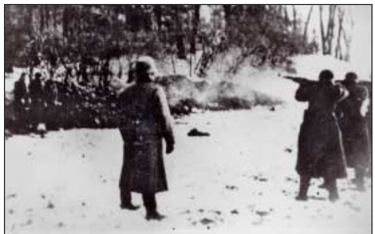
Einsatzgruppen en action.

de la Wehrmacht et une bonne partie du corps de ses officiers, par influence de la propagande ou par convictions personnelles, considèrent les Juifs comme a priori suspects dans les territoires conquis. Sans que tous ses membres aient été des criminels, l'institution de la Wehrmacht participe de façon significative aux crimes nazis.