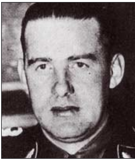
Odilo Globocnik.

Simultanément une technique de gazage au Zyklon B est testée à Auschwitz 2 à la fin de l'été 1941 tandis que les méthodes et personnels des instituts d'euthanasie sont importés vers des installations fixes, en Pologne. En octobre 1941, les sites de gazages se multiplient, dénotant qu'un changement décisif intervient dans la conception d'une solution de la question juive, qui ne passe plus par l'expulsion ou les tueries mobiles, mais par l'extermination programmée et bureaucratiquement organisée.