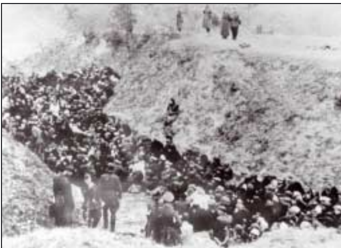
Familles juives regroupées en Ukraine avant exécution.

Par ailleurs les Einsatzgruppen trouvent auprès de certaines catégories de population un soutien important sous forme de pogroms (explosion de violence d'une communauté contre le groupe juif qui vit au milieu d'elle) ou d'engagements dans des polices auxiliaires qui collaborent aux massacres 1 . Les Einsatzgruppen établissent régulièrement le bilan global des opérations intervenues dans leur zone 2 . Au cours de la première vague, juin juillet août 1941, leurs unités annoncent dans leurs rapports environ cent mille tués par mois. En septembre 1941, il est clair que les résultats de la première vague de massacres sont insuffisants pour « régler la question juive » et il devient nécessaire d'adopter des mesures transitoires analogues à celles déjà en vigueur en Pologne : définition, expropriation, concentration. Les premières concentrations sont appliquées par les unités mobiles elles-mêmes. Les Einsatzgruppen imposent le marquage, constituent des ghettos et nomment des Conseils juifs pour les gérer, de manière à diriger la colère suscitée par la pénurie organisée contre ces Conseils. Mais dans la plupart des cas, la concentration systématique est l'œuvre des autorités militaires et civiles qui exercent des fonctions de gouvernement dans les zones occupées. Dans presque toutes les localités les Juifs sont refoulés vers des quartiers clos. L'un des premiers est celui de Kaunas en Lituanie, où la population juive est entassée dans le quartier de Viliampole.