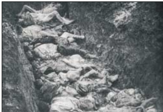
Fosse pour l'incinération des cadavres en 1942.

fonctionne par roulement. Malgré les restrictions de circulation qui doivent protéger le secret de cette opération, les nuages de fumée et la puanteur de la crémation suffisent cependant à confirmer les rumeurs sur l'élimination d'un grand nombre cadavres par crémation.