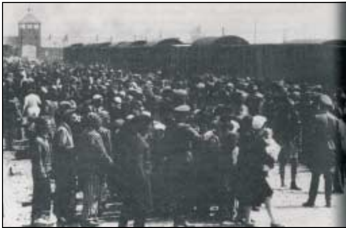
Séparation des hommes et des femmes sur la rampe de Birkenau.

La sélection à l'arrivée des trains est instaurée le 4 juillet 1942 sur un groupe de Juifs slovaques. Elle s'effectue sur la rampe de déchargement, une patrouille de garde SS entourant le train. Les personnes qui descendent des wagons sont séparées en deux groupes: ceux destinés au travail (hommes et femmes jeunes et en bonne santé), ceux destinés à la chambre à gaz (personnes âgées, enfants et leurs mères, femmes enceintes).