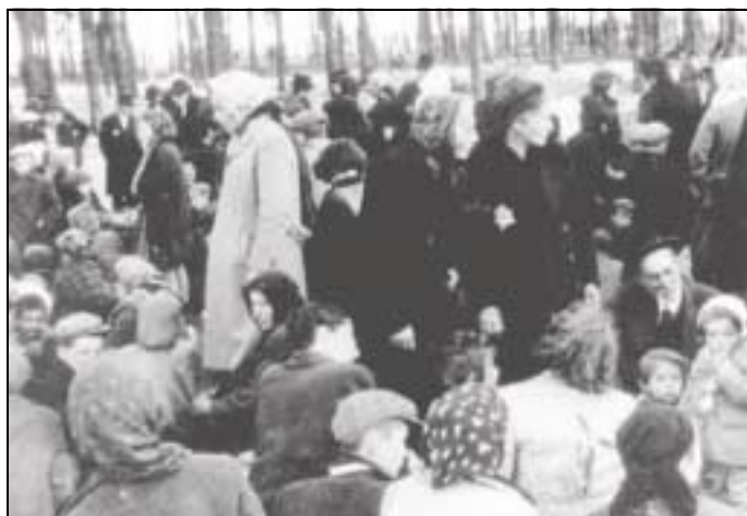
Femmes et enfants en attente dans le bois avant leur envoi à la chambre à gaz.

« Auschwitz-Opération Höss. Depuis la mi-mai, convois massifs de Juifs hongrois. Huit trains chaque nuit et cinq chaque jour. Les convois sont composés de 48 à 50 wagons, chaque wagon contient 100 personnes. Dans ces convois arrivent des « colons ». À chaque train de colons sont rattachés deux wagons transportant du bois de construction que les colons déchargent sur la « rampe de la mort » et portent vers un autre endroit où ils l'empilent en bûchers (...) qui leur sont destinés. Afin de simplifier le travail, les individus sont déjà isolés, par exemple les enfants voyagent dans des wagons spéciaux. Les trains fermés restent sur une voie spéciale plusieurs heures en attendant le déchargement (...) ils attendent dans le petit bois situé à proximité ».