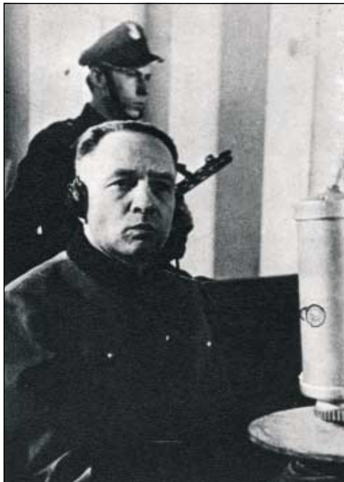
Höss lors de son procès devant la cour nationale suprême de Pologne.

Dossier réalisé par l'équipe de rédaction de Mémoire Vivante .