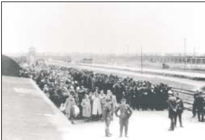
Déportés rangés en vue de la sélection peu après l'arrivée d'un train.

Sur les instances du ministère de l'armement auprès de Himmler, et après l'intégration au Reich de la Haute Silésie, le Brigadeführer Schmelt reçoit l'autorisation de prélever 10 000 détenus sur les convois de Juifs venant de l'Ouest pour remplir les camps de travail destinés aux projets d'armement les plus importants. Ces sélections pratiquées à