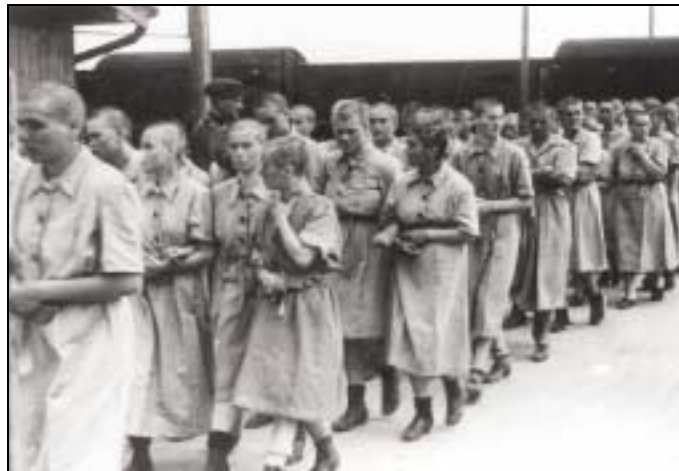
Détenues récemment arrivées se rendant au travail.

12 août et le 17 septembre 1944, quatre convois venant du camp de transit de Pruszkow livrent d'un coup 13 000 hommes, femmes et enfants arrêtés à Varsovie, après le déclenchement de l'insurrection). Les fluctuations résultent aussi de la mortalité très élevée ou des mouvements de détenus entre camps.