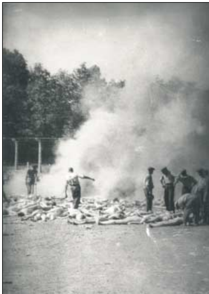
Crémation en plein air. Photo réalisée clandestinement à Auschwitz en août 1944 par un membre de la résistance intérieure du Sonderkommando. © Musée d'État d'Auschwitz.

Le 25 mai, plusieurs dizaines de Juifs arrivés le soir essaient de se cacher dans les fossés et tentent de s'évader. Ils sont tous abattus à la lueur des projecteurs.