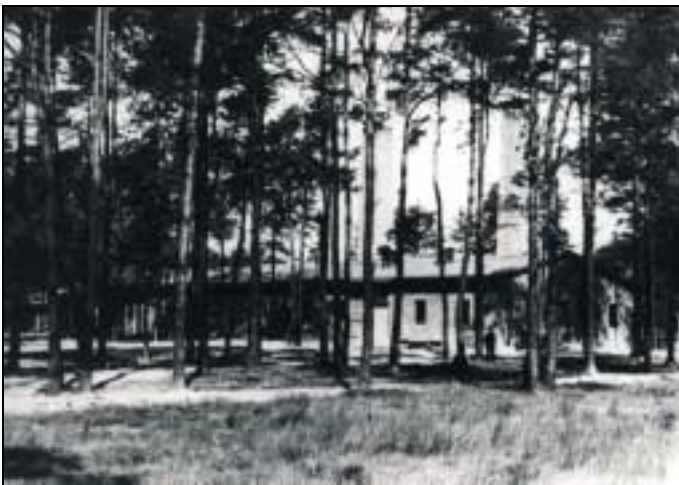
Le crématoire V au milieu d'un bois.

d'écrire à leur famille et de leur demander d'envoyer des colis de vivres. Dans leur lettre, ils doivent écrire qu'ils sont en bonne santé et que tout va bien et, en outre, indiquer comme adresse : « Arbeitslager Birkenau, Postamt Neu-Berun ». Cette opération est destinée à réfuter ou mettre en doute l'authenticité des informations concernant l'extermination des Juifs à Birkenau, dont l'opinion mondiale a connaissance par le canal du mouvement de résistance intérieure du camp.