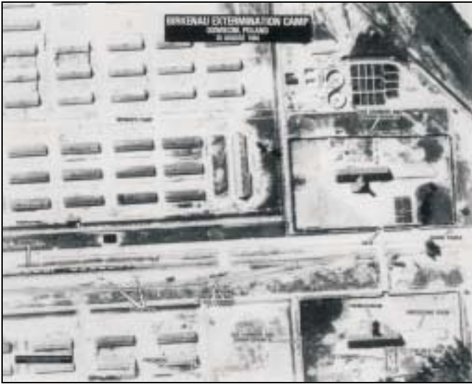
Vue aérienne prise par l'aviation américaine montrant les crématoires II et III.